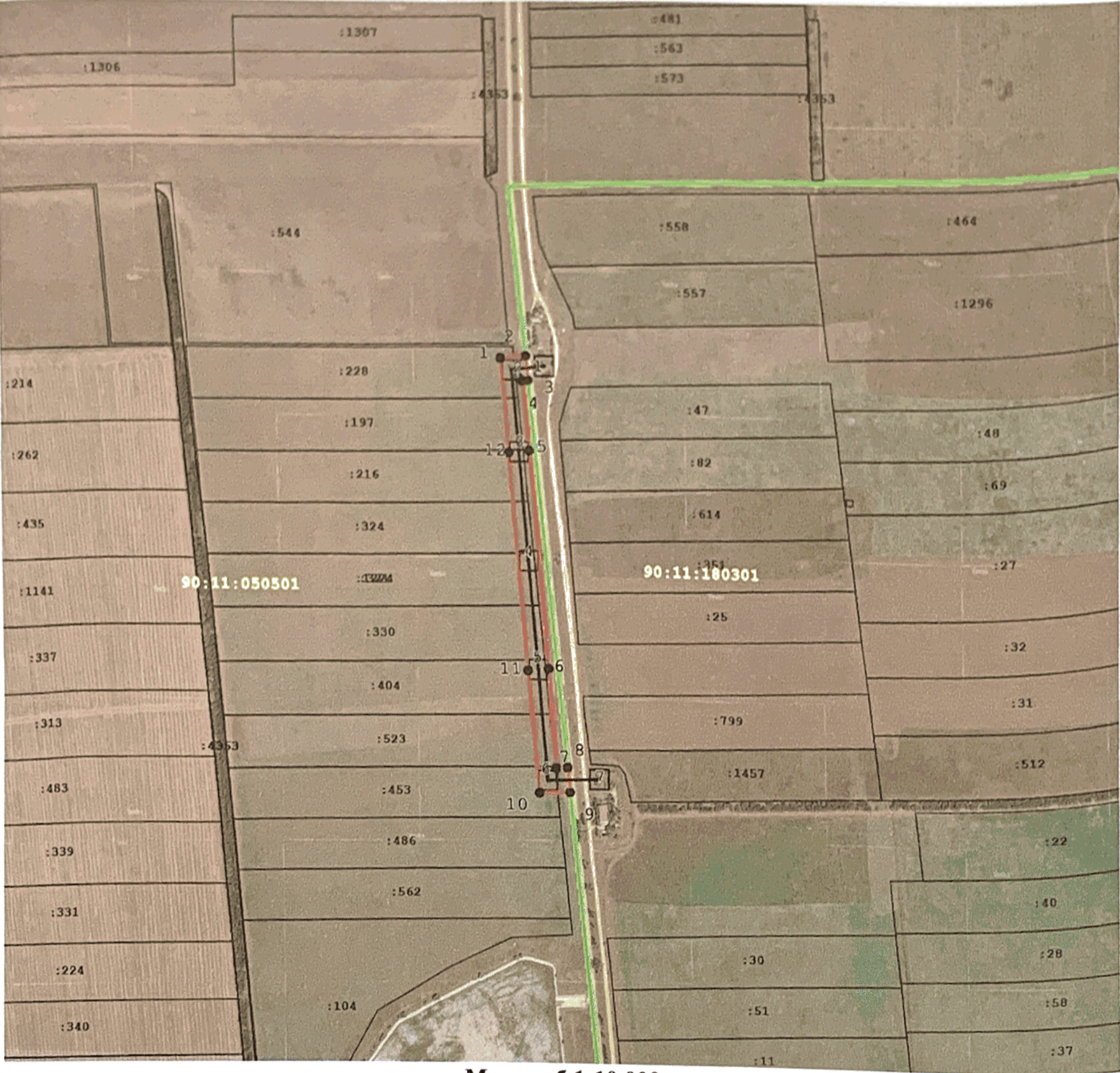
Масштаб 1:10 000

Зона публичного сервитута для эксплуатации объектов энергетики ВЛ-35 кВ НС-308 - НС-46; ПС 35/0,4 кВ НС-46 (Транзит)